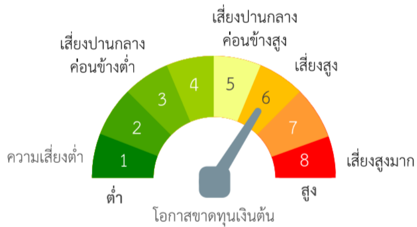
แผนภาพแสดงตำแหน่งความเสี่ยงของนโยบายการลงทุน